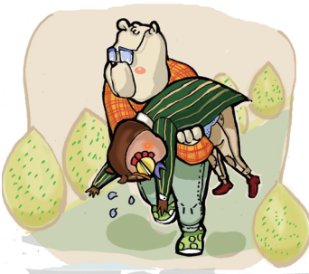
抢救溺水者的方法