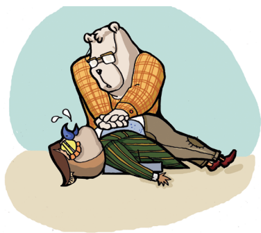
胸外心脏按压方法

病患仰卧，背部垫一硬板，头稍后仰。急救者于患者侧面右手平放于其胸骨下段，左手叠置右手背，借体重缓压胸骨约4厘米，松手腕（手仍叠置）使其复原，反复有节律地进行（每分钟60-80次），直到心跳恢复。