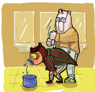
异物呛入气道的处置办法