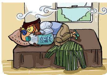
中暑的紧急处置办法